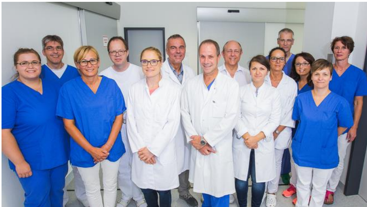
Klinik für Diagnostische und Interventionelle Radiologie/Nuklearmedizin Katholisches Klinikum Koblenz · Montabaur Alle Betriebsstätten

Durch eine kontinuierliche Modernisierung der apparativen Ausstattung bieten wir in Koblenz und Montabaur radiologische Leistungen auf höchstem Niveau an. Auf dem Boden neuester Computertechnologie verknüpft durch ein teleradiologisches Netzwerk sind Untersuchungen und Befunde an allen Standorten unmittelbar verfügbar. Möglichst geringe Strahlenexposition und möglichst geringe Belastung des Patienten für die besten Bilder und die entscheidenden Informationen sind unser Ziel.