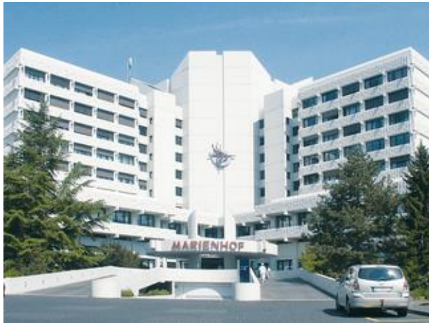
Der Marienhof in Koblenz

Der Marienhof paart seit vielen Jahrzehnten medizinische Kompetenz mit vertrauensvoller Atmosphäre und genießt überregional einen sehr guten Ruf. Schwerpunkte in der medizinischen Versorgung sind die Gynäkologie und Geburtshilfe, die Innere Medizin und Kardiologie, die Versorgung im Bereich HNO, in der Pneumologie und in der Thoraxchirurgie. Zudem ist der Marienhof Sitz der betriebseigenen Kindertagesstätte.